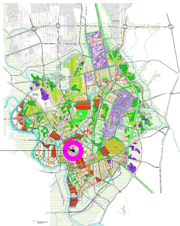
VỊ TRÍ ĐIỀU CHỈNH CỤC BỘ